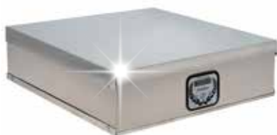
Dimensioni scocca modello unico